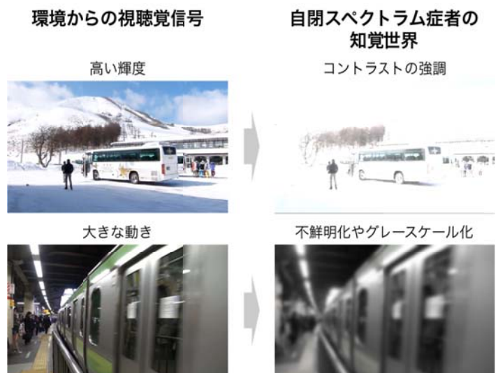
図 1: 環境からの視聴覚信号とそれにより引き起こされる自閉スペクトラム症者の知覚過敏や知覚鈍麻の症状

当研究グループでは、自閉スペクトラム症者の特異な知覚と社会性の問題にどのような関係があるのかを探るため、まず、 特異な知覚が環境からのどのような視覚・聴覚信号によって生み出されるのかを解明 しました。特異な知覚という主観的な経験を客観的かつ定量的に評価するため、画像・音声処理技術を用いてさまざまな知覚過敏・知覚鈍麻のパターンを画像フィルタとして用意し、自閉スペクトラム症者が日常生活の経験に基